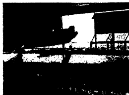
黄グループさんが赤グループだった頃、植えてくれたチューリップ。咲いてるよ！