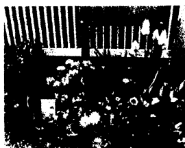
教会入り口の花壇も、おかあさん達が植えてくださったお花でいっぱい！