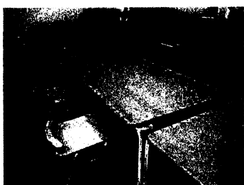
教室では、新しいテーブルと椅子がみんなを待っているよ！