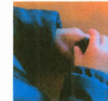
「これはこうやって・・・」

「これができて満足」という度合いは子どもによって異なりますが、子どもにとって、「自分でできた！」という感動ほど尊いものはありません。その感動は手を動かすことによって導かれるのです。