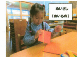
ぬいせし (ぬいもの)